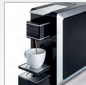
SUPPORTO REGOLABILE per tazzina espresso o mug