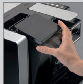
SERBATOIO DELL'ACQUA capiente