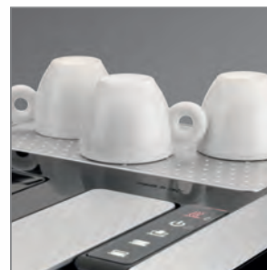
SCALDATAZZE con accensione separata