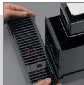
CASSETTO CAPSULE USATE facile da ripulire